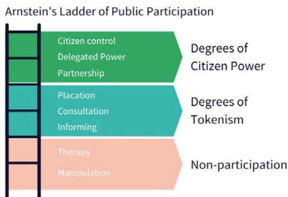
Рис. 1. Групи рівнів громадської участі (за класифікацією Ш. Арнштайна)

й владою, що сприяє обміну ідеями, врахуванню різних точок зору та спільному пошуку оптимальних варіантів розв'язання проблем. Важливо визначити, що громадська участь не обмежується лише процесами голосування на виборах [7, с. 31]. Вона охоплює широкий спектр інструментів та механізмів, включаючи громадські консультації, петиції, участь у робочих групах та інші форми діалогу. Взаємодія громадян із владою має бути постійним та системним процесом, що враховує різноманітність потреб та інтересів суспільства.