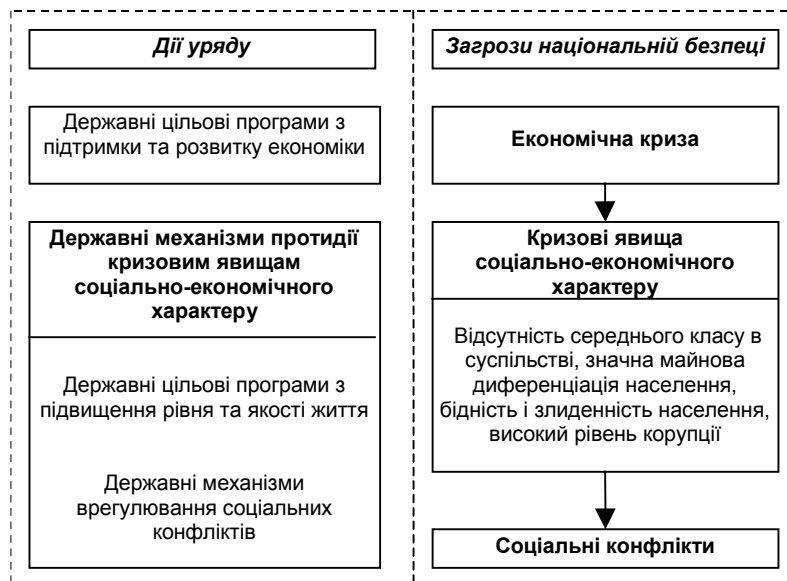
Рис. 3. Перспективні заходи механізмів протидії кризовим явищам соціально-економічного характеру в системі забезпечення національної безпеки

Отже, на кожному з перелічених рівнів необхідні адекватні й ефективні дії органів державної влади. Таким чином, виходячи з наведених вище загроз? можна схематично зазначити перспективні заходи механізмів протидії кризовим явищам соціально-економічного характеру (рис. 3).