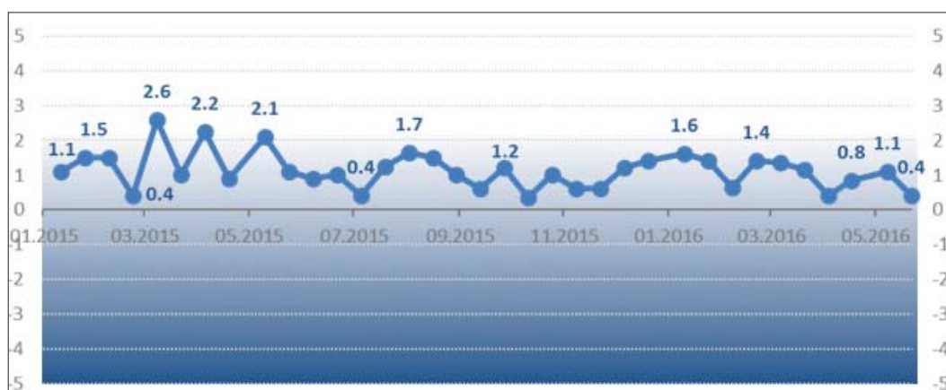
Рис. 1. Динаміка Індексу Моніторингу Реформ

Згідно зі звітом за травень 2016 року Індекс Моніторингу Реформ [4] опустився до одного з найнижчих значень: +0,4 бали. А це означає, що результативність запровадження реформ є дуже низькою та не задовольняє необхідний