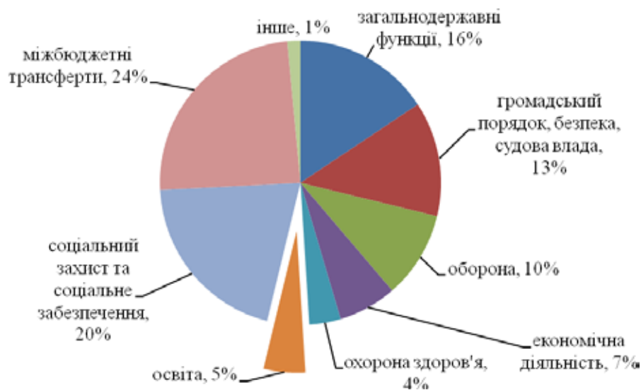
Рис. 1. Місце сфери освіти в структурі видатків державного бюджету України в 2019 р., млн. грн.