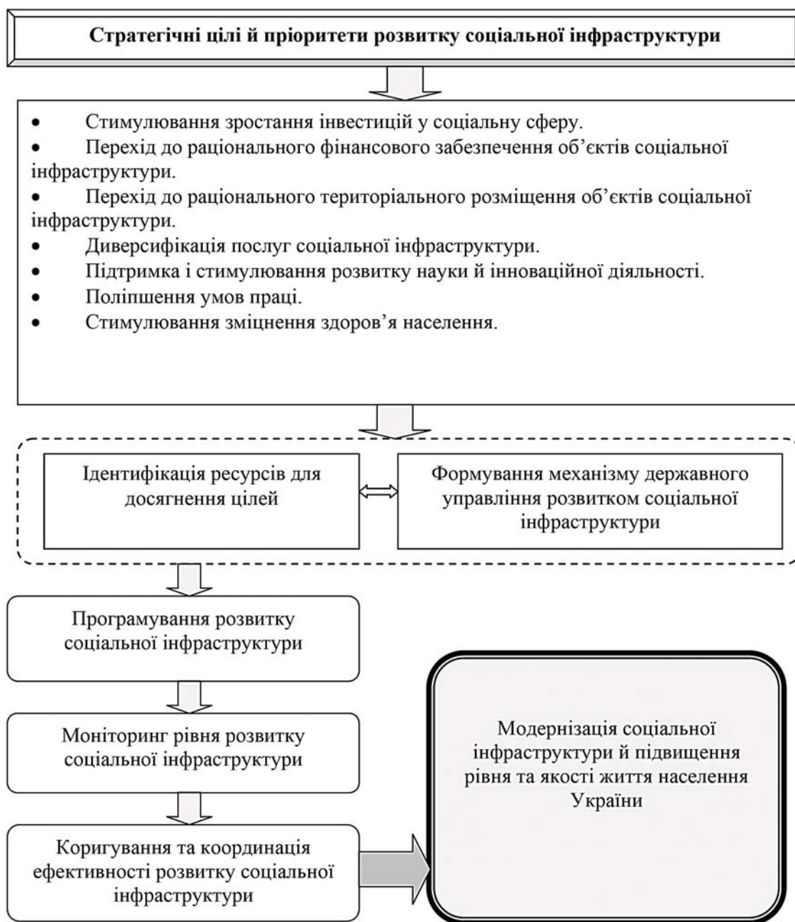
Рис. 2. Концептуальна модель розвитку соціальної інфраструктури України

У сучасних трансформаційних умовах розвитку національної економіки, де пріоритетними факторами є конкурентоспроможна наука та