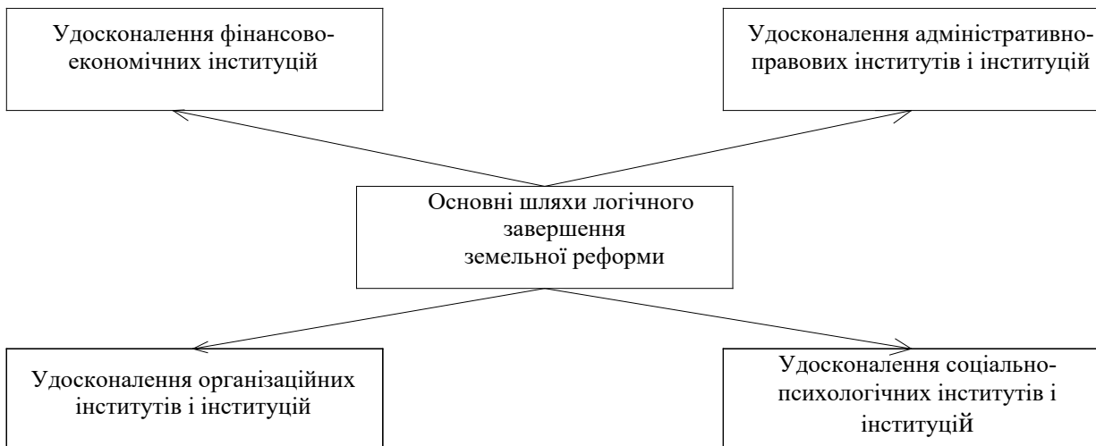
Рис. 1. Основні шляхи логічного завершення земельної реформи*