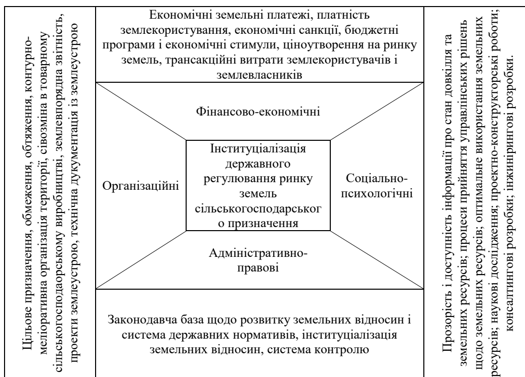
Рис. 3. Інституціалізація механізмів державного регулювання ринку земель сільськогосподарського призначення*