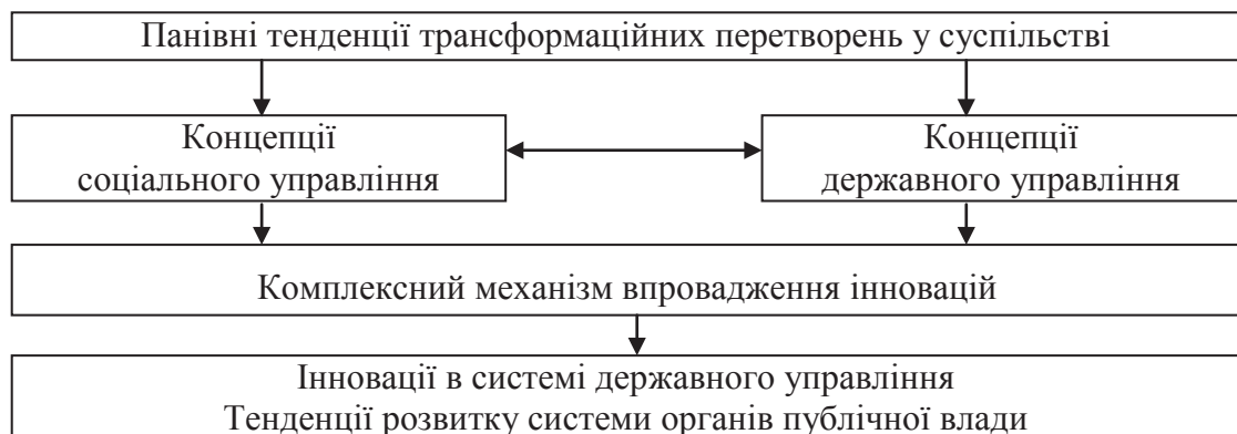
Рис. 2. Складові розвитку системи органів державного (публічного) управління