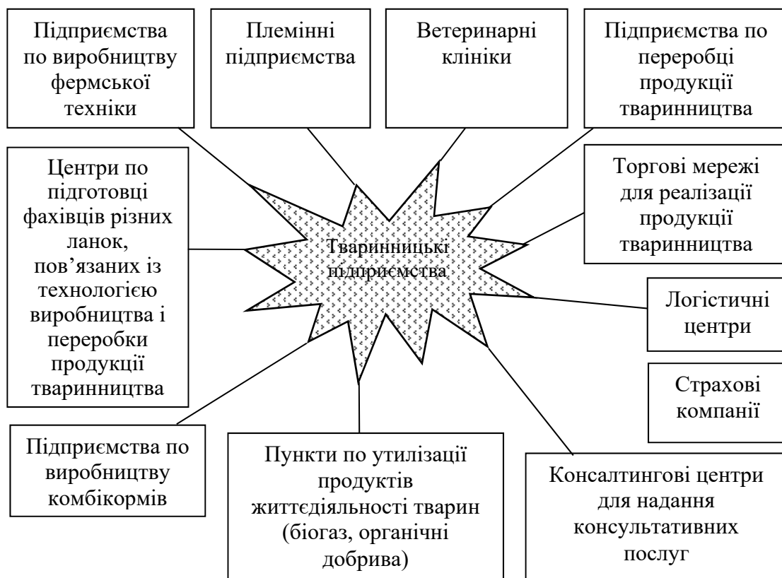
Рис. 3. Перелік бізнес-підприємств, пов'язаних з виробництвом продукції тваринництва