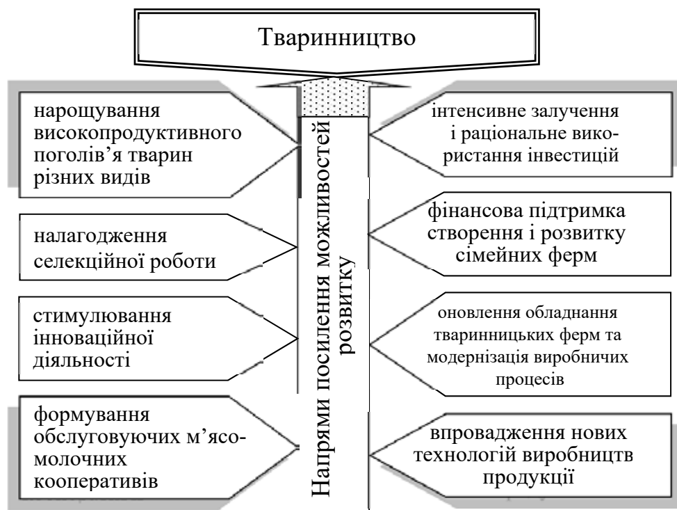
Рис. 2. Напрями посилення можливостей розвитку галузі тваринництва ( власна розробка)

ферм, доїльних залів, підприємств з переробки тваринницької продукції. У бюджеті 2023 р. року для аграріїв закладено 1 млрд грн 350 млн для закладки садів та 20 млрд грн за програмою доступних кредитів «5-7-9», тваринництву нажалі дотаційної підтримки не передбачено.